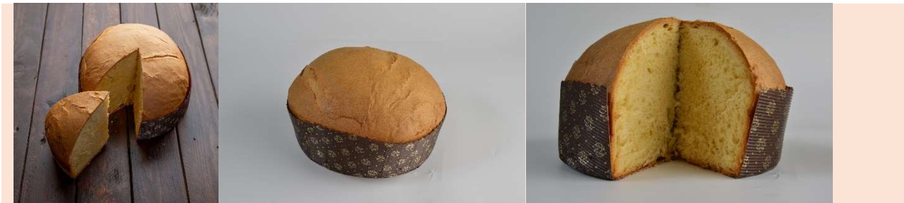
IMMAGINE DEL PRODOTTO E FORMATI DISPONIBILI / PRODUCT IMAGE AND PACKAGING SIZES

NON E' SOLO UN CONDIMENTO... MA UN ALIMENTO